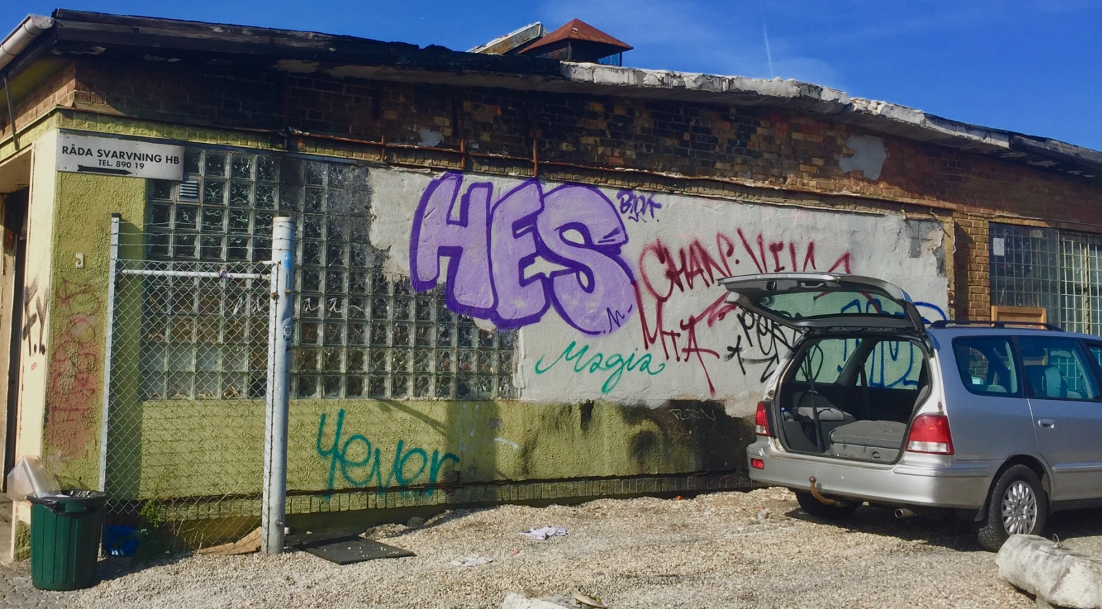
Källa: Egentagna bilder från Norra Grängesbergsgatan och graffitihangaren (2020-05-23)