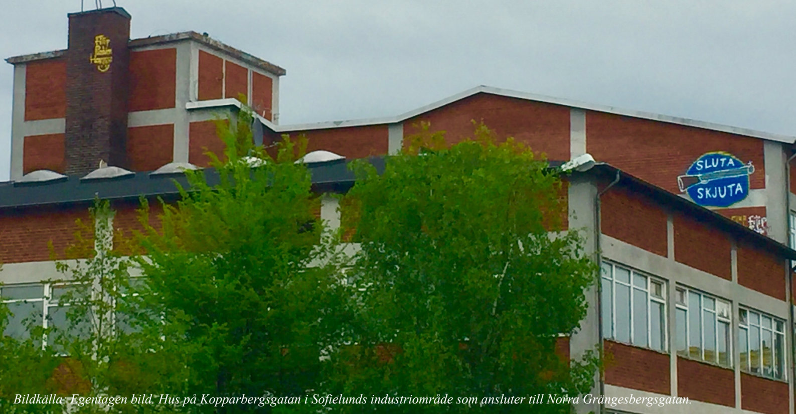
Hus på Kopparbergsgatan i Sofielunds industriområde som ansluter till Norra Grängesbergsgatan.

Detta har dock inte skett utan kritik. I media har utvecklingen av Norra Grängesbergsgatan beskrivits som att den följer den traditionella gentrifieringsprocessen. En tidigare kulturaktör på gatan och som inte längre finns kvar, har kritiserat de nämnda utvecklingaktörernas arbete i området. I insändaren 'De tidiga kulturaktörerna kan sällan vara kvar när gentrifieringen tar fart' till Sydsvenskan (2018) skriver författarna att utvecklingen på Norra Grängesbergsgatan följer gentrifieringslogiken och riskerar att trycka ut de tidiga kulturella aktörerna och verksamheterna (Sydsvenskan, 2018b).