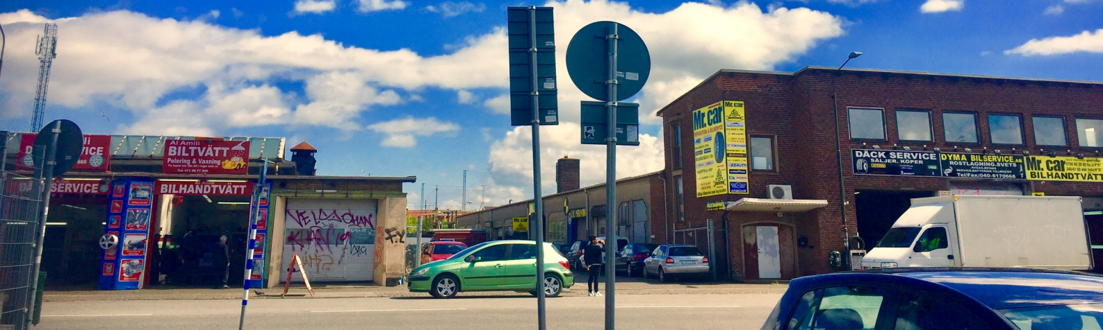
från Norra Grängesbergsgatan (2020-05-23)